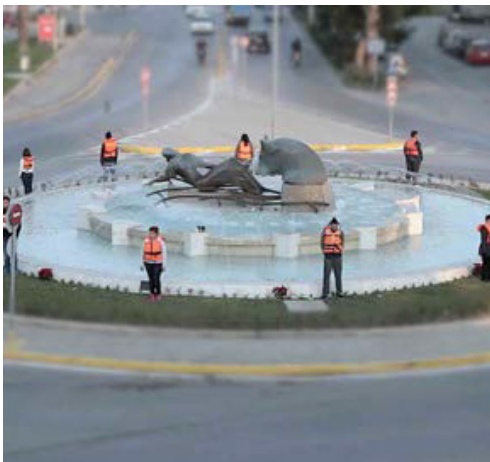
FORTRESS EUROPE (2016 ΕΓΧ 9')