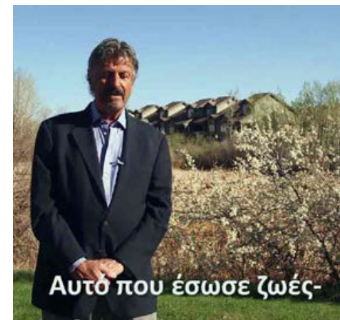
LUDLOW, ΟΙ ΕΛΛΗΝΕΣ ΣΤΟΥΣ ΠΟΛΕΜΟΥΣ ΤΟΥ ΑΝΘΡΑΚΑ (2016 ΕΓΧ & Α/Μ 71')

Η Ελλάδα ταξιδεύει χρόνια ανάμεσα στους δολοφόνους.” Τάκης Σινόπουλος - Ποιητής