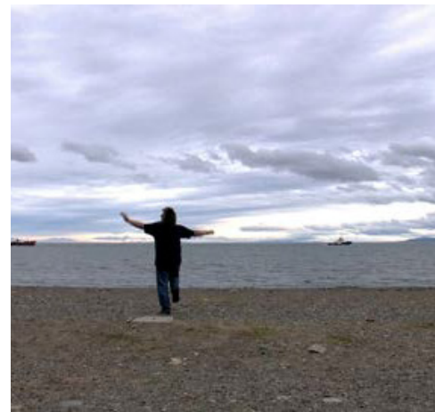
UN CONDOR (2015 ΕΓΧ 79')