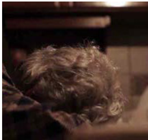
ΟΤΑΝ ΓΕΡΝΟΥΝΕ ΟΙ ΝΤΑΛΙΕΣ (2016 ΕΓΧ 14')