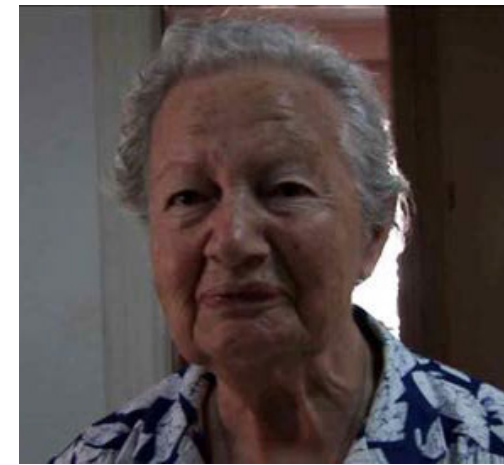
ΜΕ ΑΝΑΜΝΗΣΕΙΣ ΚΑΙ ΤΡΑΓΟΥΔΙΑ (2014 ΕΓΧ 40')

Αλεξάνδρου και του Λασιθιώτη Ναυάρχου του Νεάρχου, που διαδραματίζεται στο Δικταίο Άντρο, Ιερό Τόπο Γέννησης του Δία. Το σπήλαιο, όπου μπήκε έφηβος ο Αλέξανδρος, ανδρώθηκε με μια αρχέγονη τελετή μύησης, στην Ιερή Λίμνη, ακολουθώντας την πατρογονική του μοίρα, που ήταν να γίνει ο Βασιλιάς όλου του Κόσμου.