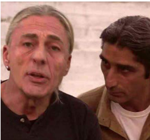
ΠΩΣ ΝΑ ΣΩΠΑΣΩ (2015 ΕΓΧ & Α/Μ 98')

Διαγωνιστικό 2016, Ειδικό Βραβείο Παρ.: ΦΙΛΟΔΗΜΟΣ Σκην. Σεν. Κιν. Σχ. Αφήγ.: Μαραγκός Θόδωρος Δ. Παρ.: Κολοβός Θόδωρος Δ. Φωτ.: Ναυπιώτης Νίκος Οπερ.: Αναπολιτάνος Γιώργος, Κομνηάς Τζαννέτος, Στέφος Νίκος Μοντ.: Σιούτης Γρηγόρης Μουσ.: Μαραγκός Στάθης Ηκολ.: Σιούτης Γρηγόρης Ενδυμ.: Μαραγκού Αγγελική Μακιγ.: Βώκου Αγγελική Β. Σκην.: Καπελούζος Γιώργος Συμμ.: Κολοβός Θόδωρος, Προκοπίου Θόδωρος, Κανδήλης Άγγελος, Φώτω Γαρυφαλιά, Μυλωνά Αρχοντία, Κολοβού Χαρούλα, Καρβέλης Κώστας, Ρίσκας Στέφανος, Πρεσβείας Γιάννης, Κορδαλή Λίτσα, Δενδρινός Νίκος, Κολοβού Σωτηρία, Σιούτης Γρηγόρης, Χειράκης Ηλίας, Χαλβατζής Θωμάς, Λαπατάς Φιλ. Συμμ.: Τσάκωνας Κώστας, Παπανίκα Καίτη