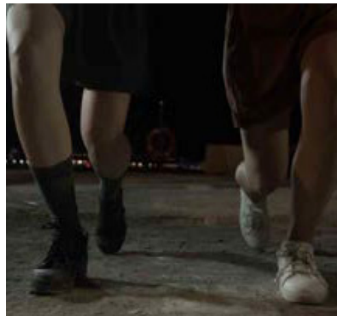
ΠΡΟΣΩΠΑ (2016 ΕΓΧ 10')

Τον Ιούλιο του 1936, τότε που ανοίγει το Χαρέτσι για την αγορά των κουκουλιών, ξεκινά η μεγάλη απεργία των σπυροτρόφων και των μεταξεργατριών στην περιοχή του Σουφλίου. Κρατά περίπου 10 μέρες. Ξεσηκώνεται όλη η επαρχία. Οικογένειες ολόκληρες έρχονται στο Σουφλί. Κατασκηνώνουν στην κεντρική πλατεία. Η εργατική βοήθεια μοίραζε ψωμιά, κουλούρια και 50 δράμια τυρί. Υπήρχαν και πλούσιοι άνθρωποι που τα διέθεσαν όλα. Μέρα-νύχτα η πλατεία γεμάτη. Το σύνθημα «100 ή θάνατος» (100 δραχμές η τιμή αγοράς ανά κιλό των κουκουλιών). «Μεροκάματο αύξηση, νερό και καλύτερες συνθήκες» για τις μεταξεργάτριες. Έντονη αγωνιστική διάθεση και η Πνύκα ανοιχτό βήμα για όλους. «Τις αγοράζειν βούλεται».