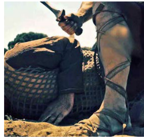
ΕΝΑΣ ΘΕΟΣ ΓΕΝΝΙΕΤΑΙ (2015 ΕΓΧ 40')

Πόλη. Αυτοί οι άνθρωποι που πέρασαν από τους πλακόστρωτους δρόμους της, έφεραν ως την Ελλάδα αυτό που αργότερα ονομάστηκε «πολιτική κουζίνα». Στις λιγοστές αποσκευές τους όμως, κουβαλούσαν κι άλλα. Μια ζωή που διατηρείται ακόμη μέσα από τη μνήμη. Ένα δραματοποιημένο ντοκιμαντέρ, που «επιστρέφει» από τη μνήμη μιας Πολίτισσας, παρακολουθώντας από απόσταση 41 ηθοποιούς και χορευτές να περνούν μέσα από την ιστορία, σα μια βόλτα στο άλλοτε κατάφυτο Taksim Park.