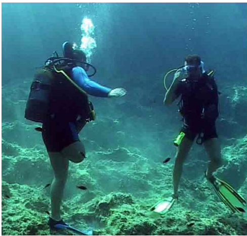
ΕΙΣ ΒΑΘΟΣ (2007 ΕΓΧ 56')

Διαγωνιστικό 2016 Παρ.: ΚΟΥΡΜΟΥΖΑΣ ΓΙΩΡΓΟΣ Σκην.: Κομηνέας Τζαννέτος Δ. Παρ.: Κουρμούζας Γιώργος Δ. Φωτ.: Παπάζογλου Στέλιος Μοντ.: Κομηνέας Τζαννέτος Μουσ.: Υπερείδης Ερατοσθένης Ηκολ.: Φραγκουλάκης Γιάννης