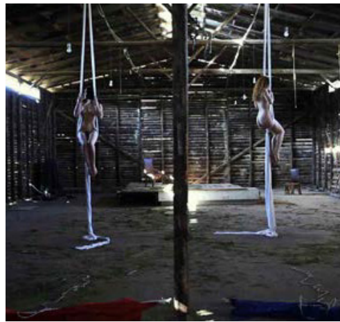
aPOLIS (2014 ΕΓΧ 59')

Μια κατάδυση που ξεκινάει από τη στιγμή της σύλληψης και συνεχίζει καθ' όλη τη διάρκεια της ζωής του ανθρώπου. Το υγρό στοιχείο συνυφασμένο με τη ζωή, την κάθαρση, τον εξαγνισμό, την γαλήνη, και την ισορροπία της ανθρώπινης φύσης.