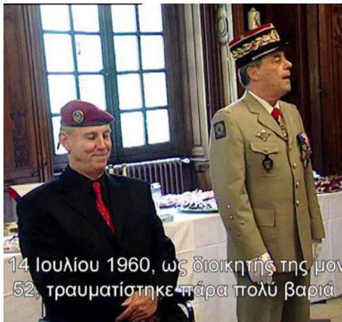
MICHEL FOUCRE (2016 ΕΓΧ & Α/Μ 95')

Μία γιαγιά στην Κρήτη, αναδεικνύει τη σπουδαιότητα της βρώσης των άγριων χόρτων της Κρήτης. Μέσα από την καθημερινότητά της και τις αφηγήσεις της, για τα περασμένα, προσπαθεί να περάσει στην εγγονή της όλες τις γνώσεις της και να την κάνει να αγαπήσει την κρητική διατροφή και παράδοση.