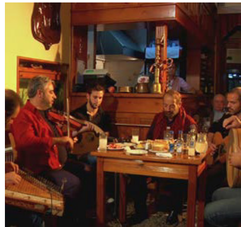
ΑΜΑΝΕΔΕΣ ΣΤΟ Β. ΑΙΓΑΙΟ (2016 ΕΓΧ 80')