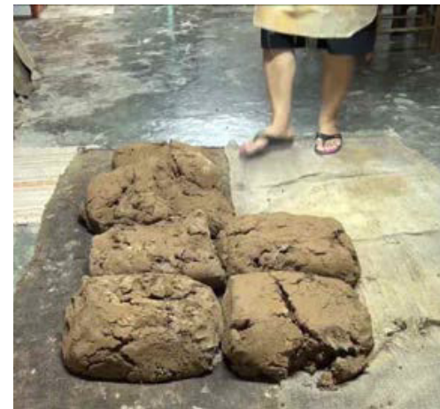
ΣΤΗΝ ΑΚΡΗ ΤΟΥ ΚΑΒΟΥ (2015 ΕΓΧ 24')