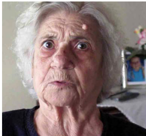
ΜΑΝΕΣ ΚΑΙ ΚΟΡΕΣ (2015 ΕΓΧ & Α/Μ 28')

Με λένε Θόδωρο, με λένε Τόνια, με λένε Χαρά, με λένε Ορφέα, έχω κι εγώ ένα λόγο να καταθέσω... Η Ελλάδα δέχεται μια τρομακτική επίθεση από τα αρπακτικά της Ευρωπαϊκής εξουσίας, τους διεθνείς τοκογλύφους. Ο Ελληνικός λαός, προδομένος και από την ηγεσία του, αιφνιδιάζεται. Προσπαθούν να ξεριζώσουν ακόμα και την καρδιά του. Ο Θόδωρος και ο Θόδωρος από τους Αγίους Θεοδώρους, μαζί με άλλους πέντε, βρίσκουν καταφύγιο σε ένα ξεχασμένο χώρο πολιτισμού, πάνω στο βουνό, δίπλα σε γκρεμό. Θα αυτοκτονήσουν ή θα επαναστατήσουν; Αποφασίζουν να κάνουν αντάρτικο πολιτισμό.