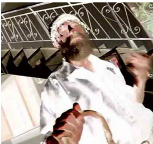
ΚΕΝΤΡΙΣΜΑ ΓΗΣ (2016 ΕΓΧ & Α/Μ 48')

Διαγωνιστικό 2016, Τιμητική Διάκριση Παρ.: RGB STUDIOΣ Σκην. Σεν. Δ. Φωτ. Μοντ.: Μαυροφοράκης Χάρης Μουσ.: Κούρτης Πέτρος Σχεδ. Ήχου: Κόρδης Δημήτρης Συμμ.: Αργυράκης Γιάννης, Αργυράκη Καλλιόπη, Κακουδάκης Γιάννης, Μαμαλάκης Κώστας, Παλουμπής Χαράλαμπος, Παπαδάκης Κώστας, Ροδιτάκης Χάρης