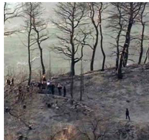
Η ΣΤΑΧΤΗ ΠΟΥ ΜΕΝΕΙ (2008 ΕΓΧ & Α/Μ 66')

Το 2003 η επιστημονική ομάδα «ΝΑΟΥΔΟΜΟΣ», ξεκίνησε την ανακατασκευή μιας προϊστορικής πεντηκοντόρου, όπως ήταν η μυθική Αργώ, στο πλαίσιο ενός ερευνητικού προγράμματος πειραματικής ναυτικής αρχαιολογίας. Αυτή είναι η ιστορία αυτού του πλοίου - από την επιλογή των δέντρων για την κατασκευή του, που διήρκεσε δύο χρόνια και ύστερα το ταξίδι στη θάλασσα. Δέκα χιλιάδες κουπιές την ημέρα, χρειάζεται να κάνουν οι κωπηλάτες, για να φτάσουν από το Βόλο στην αρχαία Κολχίδα. Ένα ταξίδι 1.200 μιλίων που πρέπει να ολοκληρωθεί σε 60 ημέρες. Θα αντέξουν οι 74 εθελοντές κωπηλάτες αυτή την καθημερινή δοκιμασία; Ή θα μετατραπεί αυτή η σύγχρονη αργοναυτική εκστρατεία σε μία ακόμα Οδύσσεια;